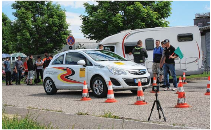
Das Bild zeigt einen Opel Corsa, der für die Youngster-Cup-Meisterschaft des ADAC Südbaden den jungen Nachwuchsfahrern zur Verfügung gestellt wird.