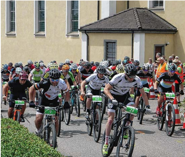
Spannende Rennen sind am 2. Juni beim zehnten Neuhauser Cross-Country-Rennen für Hobbyfahrer zu erwarten.