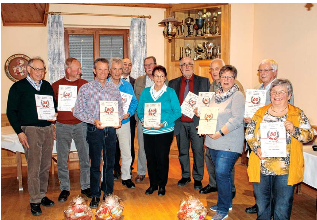
Die geehrten Vereinsmitglieder des RV Bittelbrunn im Vereinsjahr 2019.

Für die Verpflegung der Besucher ist gesorgt.